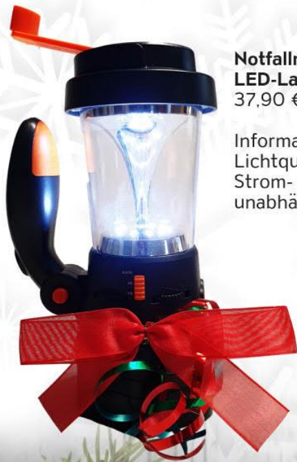
Notfallradio mit LED-Lampe 37,90 €

Informations- und Lichtquelle in einem. Strom- und batterieunabhängig